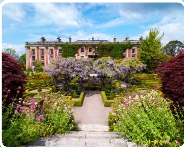
Bantry House and Garden

sagenhaften Ausblicken auf unglaubliche Klippenlandschaften. Begeistern wird Sie aber auch der herrliche Barley Cove Strand!