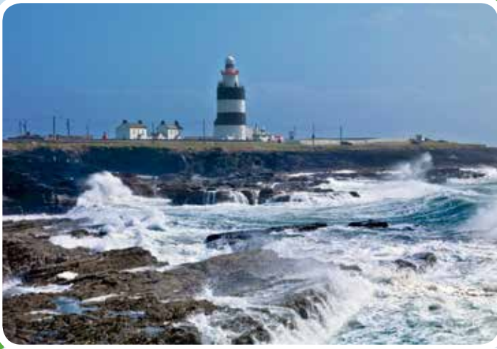
Hook Head Lighthouse

für Leuchtturmenthusiasten, der vielleicht älteste Leuchtturm der Welt auf Hook Head, der zeitweilig sogar Teil eines Klosters war. Er geht zurück in die normannische Periode Irlands.