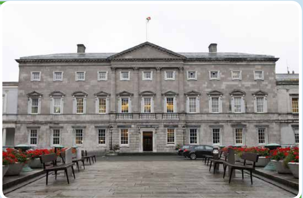
Irish Parliament (Dáil Éireann)

Tag in Irland wird Sie „erfüllen“: Unser Besuch des irischen Parlaments, des „Dáil“, besteht nicht nur aus einer Führung durch dieses im 18. Jh. von dem hessischen Architekten Richard Cassels entworfene einstige Herrenhaus. Wir werden auch eine/n Parlamentarier/in treffen und über aktuellste politische Themen, das moderne Irland betreffend, diskutieren. Danach wird noch etwas Zeit für einen Aufenthalt in Irlands Hauptstadt sein, auch mit der Gelegenheit zum Besuch einer Ihnen wichtigen Sehenswürdigkeit. Vielleicht wollen Sie aber zum Abschluss nur die lebendige Innenstadt um den Temple Bar Bezirk oder Grafton Street erkunden? Ihre Reiseleiter werden Ihnen bei der Planung helfen! Nachmittags Weiterfahrt zum Flughafen und Rückflug nach Düsseldorf.