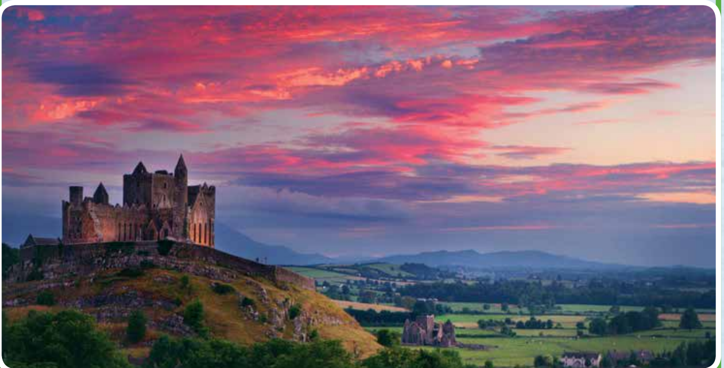
Rock of Cashel