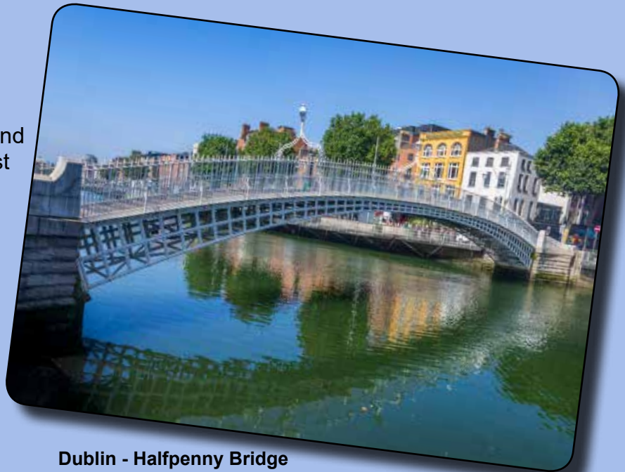
Dublin - Halfpenny Bridge

Nachmittags Treffen mit einem/r Vertreter*in des European Movement Ireland oder einem/r Vertreter*in des irischen Flüchtlingsrat (Irish Refugee Council) sowie Zeit zur freien Verfügung.