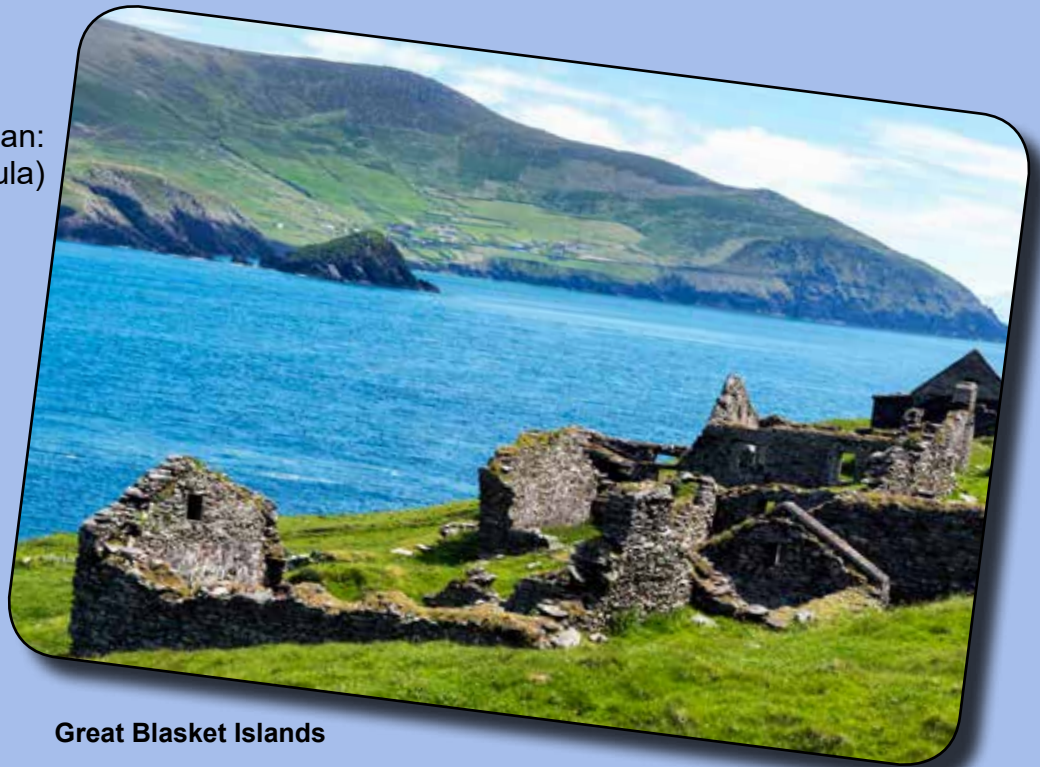
Great Blasket Islands

Sie liegt vor Slea Head , also westlich der Dingle Halbinsel . Sie ist nicht nur berühmt für ihr literarisches Erbe (Thomas O’Crohan, Peig Sayers, Maurixie O’Sullivan...), sondern ist auch landschaftlich ein absolutes Highlight!