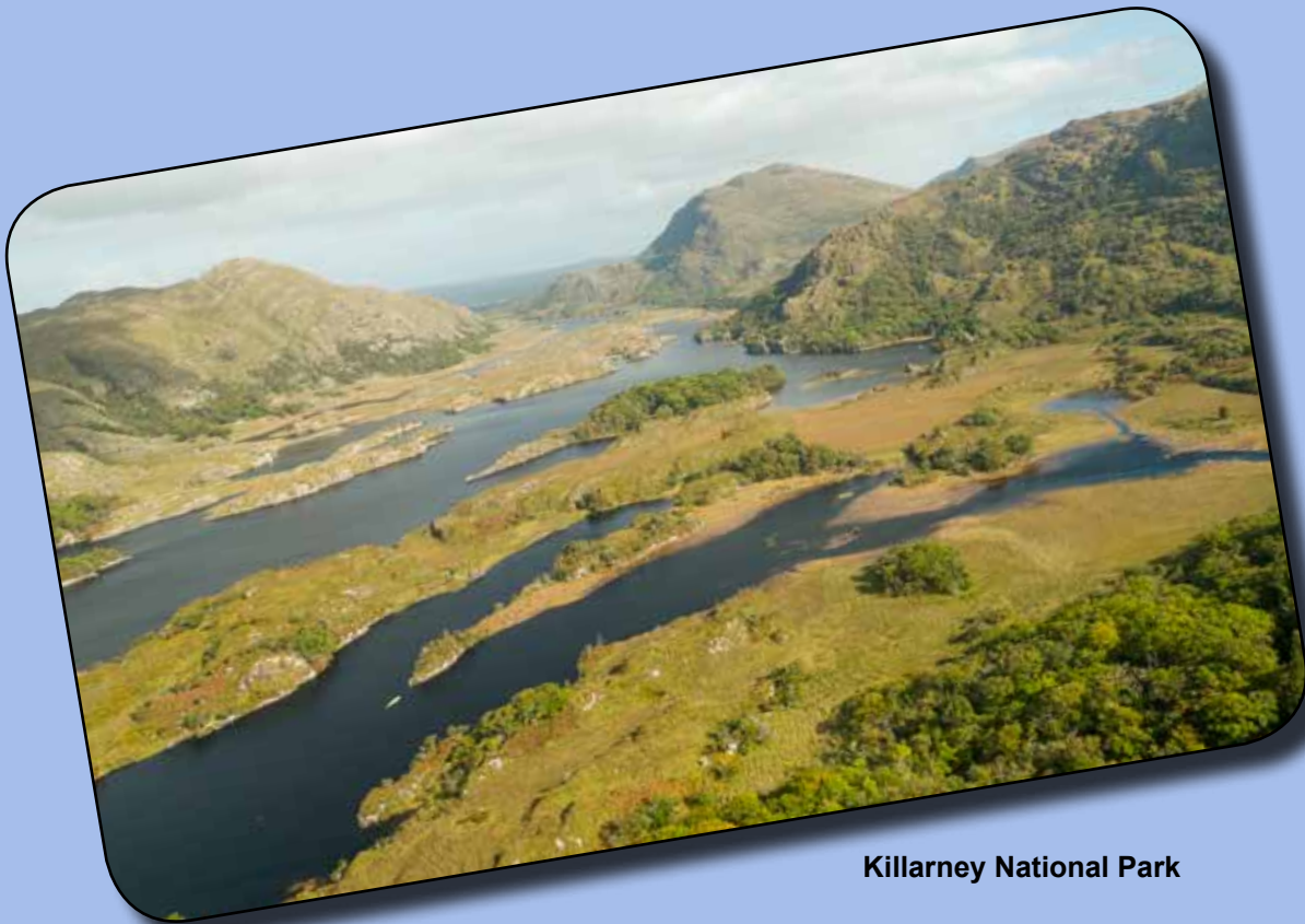
Killarney National Park