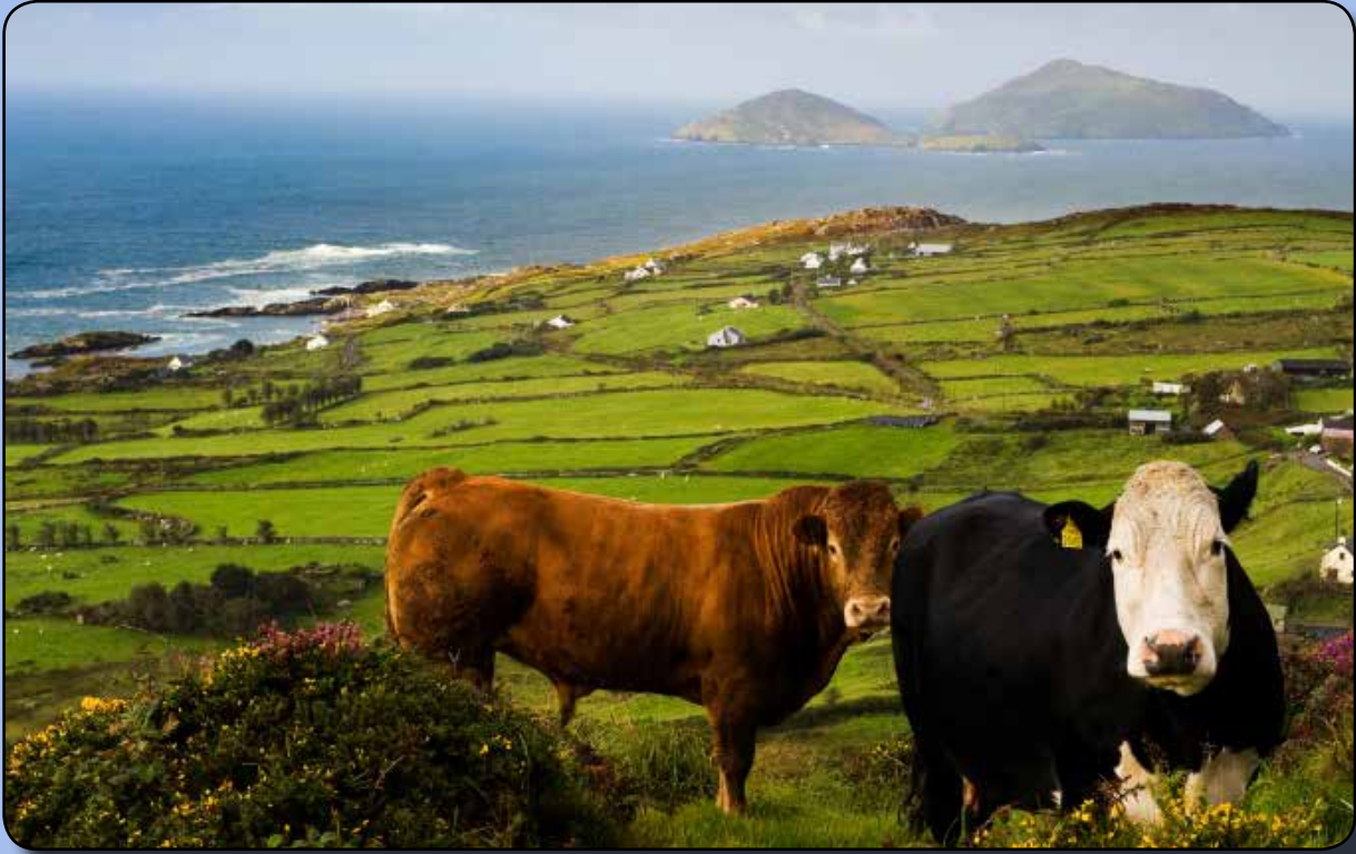
Ring of Kerry