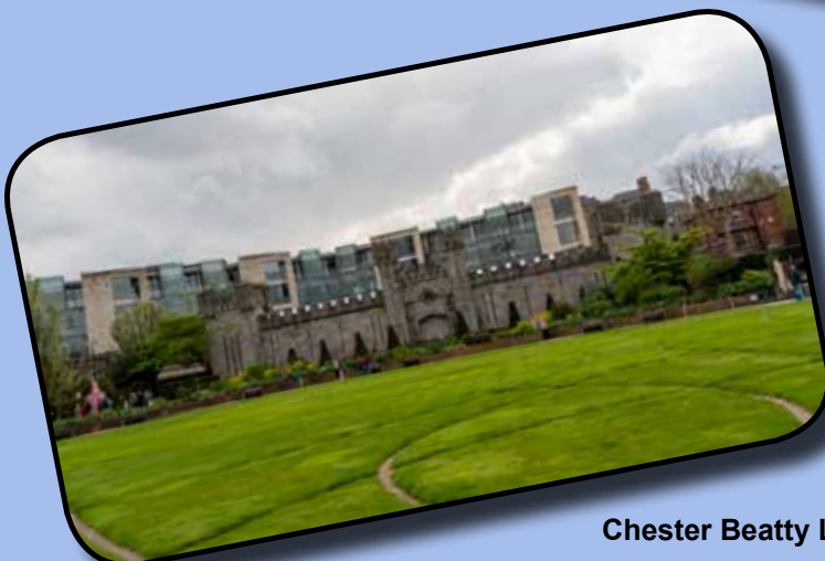
Chester Beatty Library