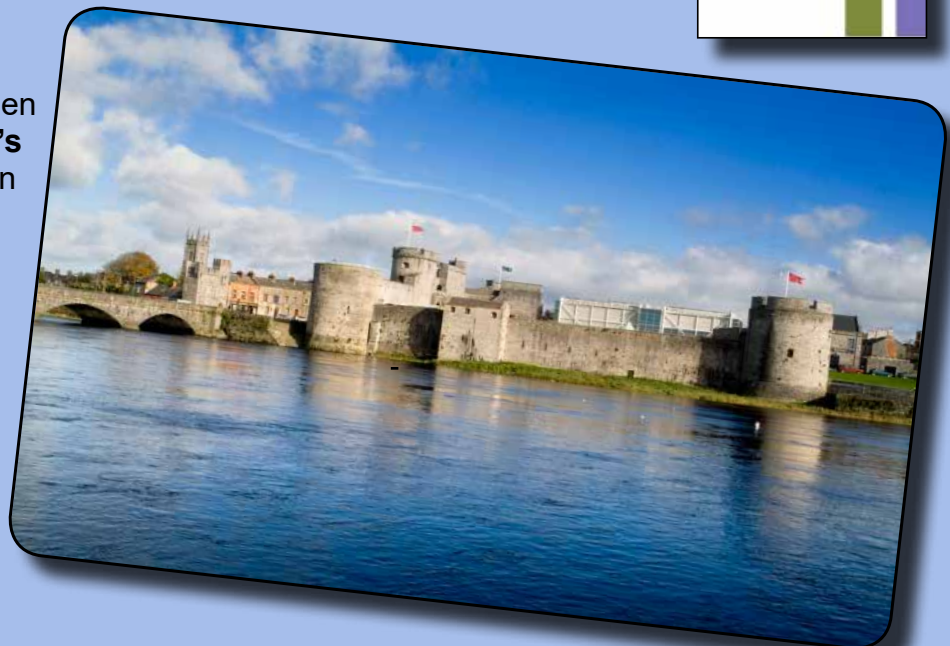
King John's Castle Limerick