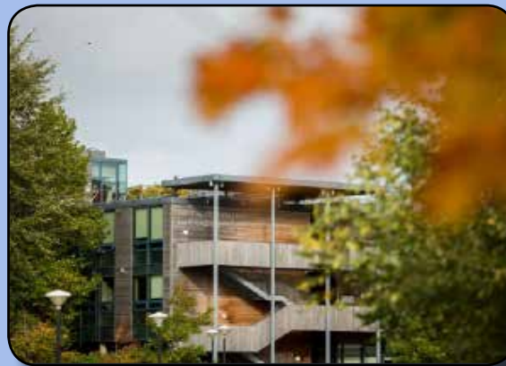
Center for Irish-German Studies